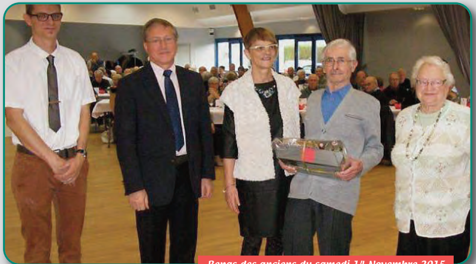
Repas des anciens du samedi 14 Novembre 2015