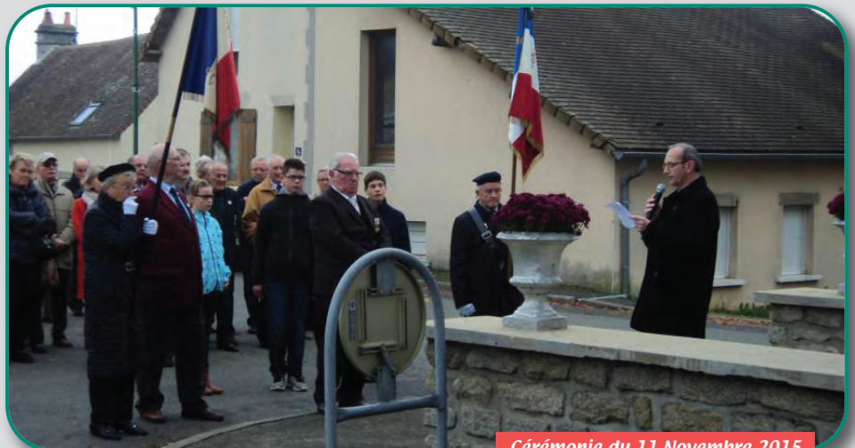
Cérémonie du 11 Novembre 2015