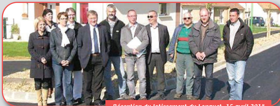
Réception du lotissement du Longuet, 15 avril 2014

Quoiqu'il en soit, notre engagement devra être sans faille, solidaire, intègre mais aussi comme il est de tradition, au sein de notre conseil, totalement apolitique. Cela conditionne notre réussite. A ce propos, je voudrais préciser que chaque membre du conseil avait indiqué sur sa déclaration de candidature aux élections municipales, formulaire désormais obligatoire, être sans étiquette politique. Pour des raisons statistiques, les services de l'Etat ont pris l'initiative de nous attribuer d'office, comme à d'autres communes, un rattachement politique. Face à la levée de bouclier d'un grand nombre de candidats, la préfecture a rapidement supprimé ce classement. C'est beaucoup mieux ainsi.