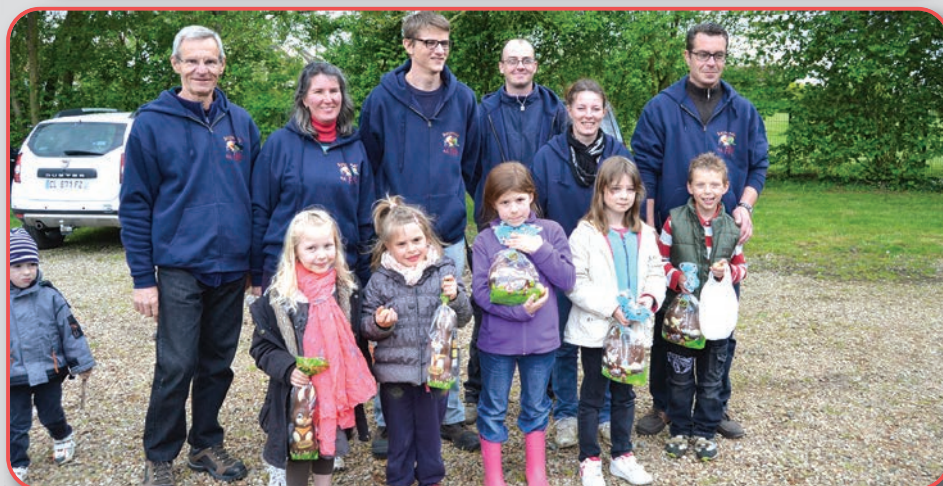
Chasse aux œufs, 20 avril 2014