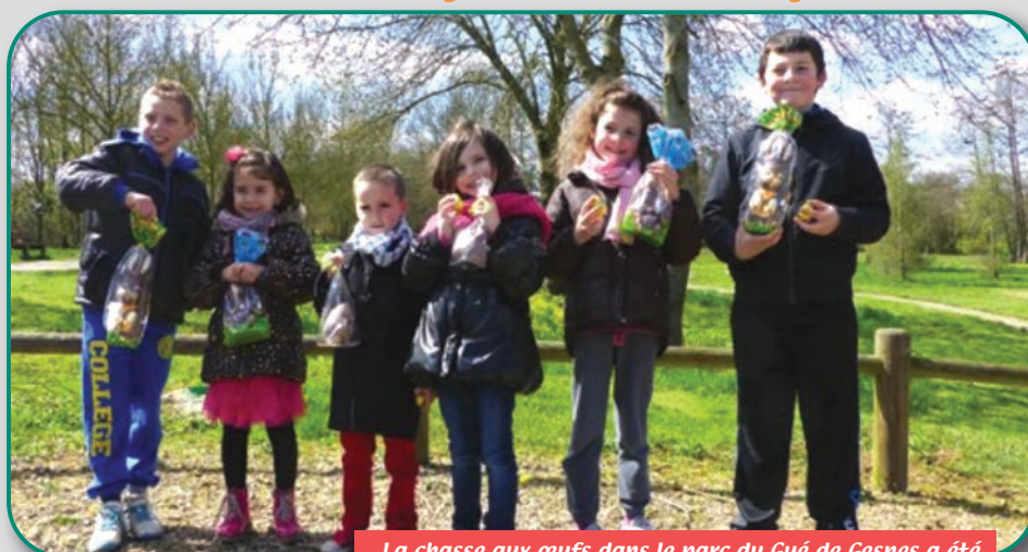
La chasse aux œufs dans le parc du Gué de Gesnes a été organisée par le comité des fêtes pour les enfants.